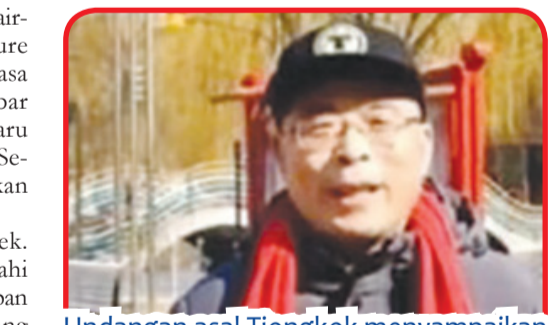
Undangan asal Tiongkok menyampaikan Selamat Tahun Baru Imlek.

dari seluruh Indonesia juga berpartisipasi aktif dalam acara tersebut.