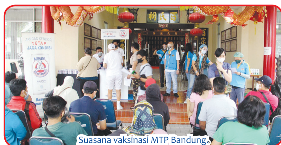
Suasana vaksinasi MTP Bandung.