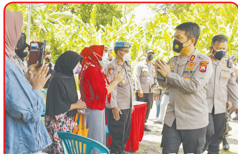
Masyarakat peserta vaksinasi menyambut kedatangan rombongan Kapolda Jatim Irjen Pol Nico Afinta.

Mengakhiri kegiatan, Kapolda memberikan paket bantuan sosial bagi masyarakat terdampak Covid-19 yang membutuhkan. • anto tze