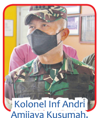
Kolonel Inf Andri Amijaya Kusumah.

BANDUNG (IM) - Pada awal tahun ini, varian baru virus Covid-19 kembali merebak, akibatnya pandemi Covid-19 mulai meningkat lagi.