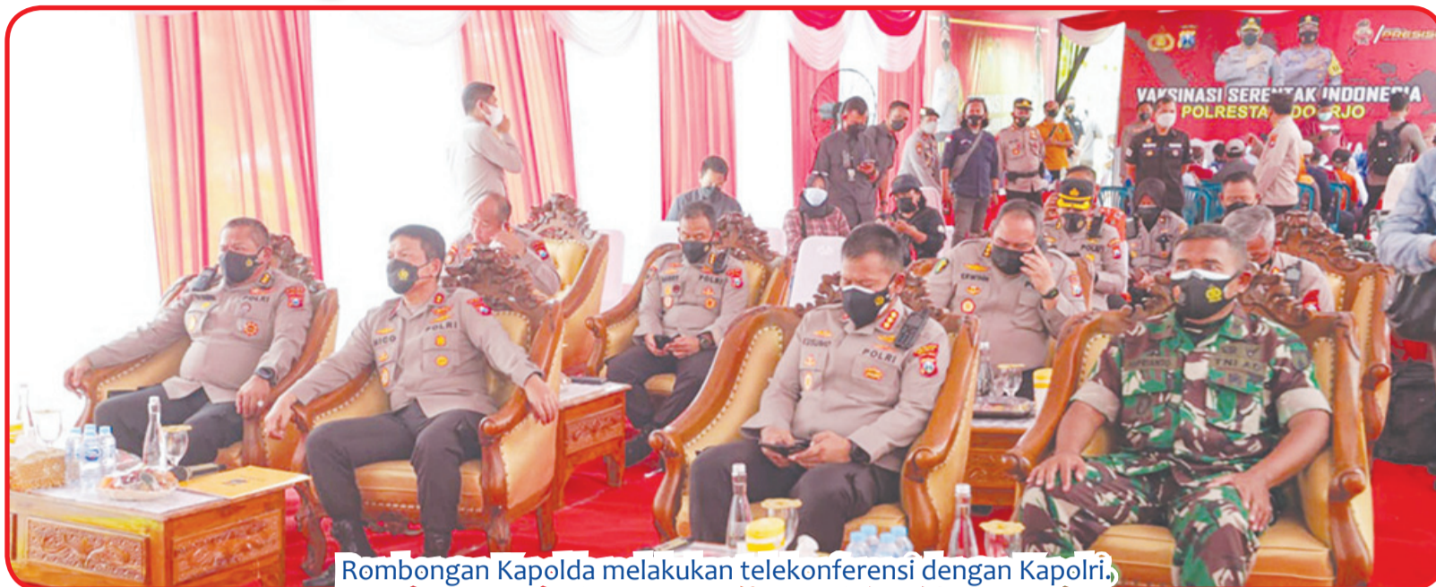
Rombongan Kapolda melakukan telekonferensi dengan Kapolri,

"Khusus di lokasi ini dilaksanakan vaksinasi 800 dosis. Dengan sasaran 300 dosis vaksin booster lansia dan 500